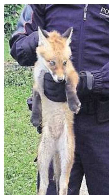
Ein Polizist mit Handschuhen und Gartenschere half dem Fuchs.